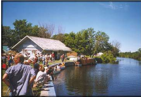
La boutique « Depot »