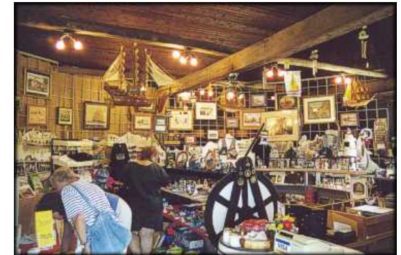
À l'intérieur de la boutique « Depot »

Pour plus d'information, consultez notre site Web au : www.rideaufriends.com